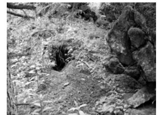
Dachsbau in Bunkeranlage

Dachssippen errichten in oder unter Bunkeranlagen ihre „Dachsburgen“, die Jahrzehnte hindurch bewohnt und erweitert werden. Sogenannte Dachmutterbaue finden sich in einer neu gezäunten Anlage in der Schneifel und in einer gesprengten Vergleichsanlage an der Oberen Kyll und zwei weiteren Bunkeranlagen im Bienwald.