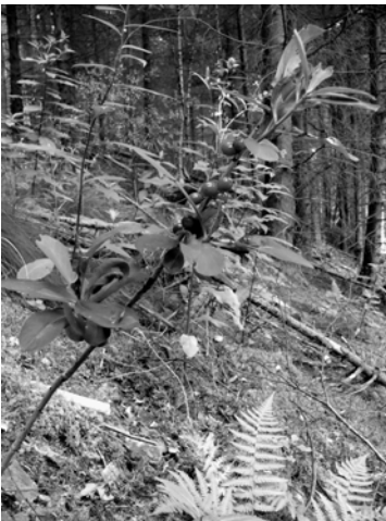
Seidelbast auf Bunkerstandort

Auf kleiner Fläche besteht durch die unterschiedlichen Standortfaktoren eine hohe floristische und pflanzensoziologische Diversität. Vom temporären Stillgewässer bis zum Trockenrasen und von Magerweiden bis zu nährstoffreichen Ruderalgesellschaften ist die ganze Palette vertreten. Bemerkenswerte und Rote-Liste-Arten wie Blauer Eisenhut ( Aconitum napellus ), Seidelbast ( Daphne mezereum ), Kleines Wintergrün ( Pyrola minor ), Weiße Waldhyazinthe ( Platanthera bifolia ), Geflecktes Knabenkraut ( Dactylorhiza maculata ) sind bisher an Westwallanlagen nachgewiesen worden (OSTERMANN 2005). RÖLLER (2002, 2003, 2004) wies 72 Moosarten an Westwallbunkern nach, von denen sich 34 Arten auf der Roten Liste für Deutschland und 17 Arten auf der Roten Liste für Rheinland-Pfalz befinden. Eine besonders bemerkenswerte Art ist beispielsweise Entodon schleicheri (Schleichers Zwischenzahnmoos, RL1), von der sich alle bisher bekannten rheinland-pfälzischen Nachweise (PHILIPPI 1977 im