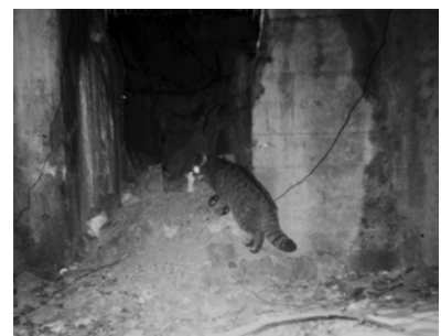
Wildkatze nutzt Vergleichsbunker

Für Fledermäuse bietet die Gesamtanlage des Westwalls heute Quartiere und Trittsteine im Biotopverbundsystem. Praktisch jede Bunkeranlage mit im Winter frostfreien Hohlräumen und Spalten (vorwiegend in der Deckenplatte), ist als Quartier geeignet. Das Artenspektrum der Bunkeranlagen im Untersuchungsgebiet umfasst sechs Arten (Gr. Mausohr, Bechsteinfledermaus, Braunes Langohr, Fransenfledermaus, Zwergfledermaus, Bartfledermaus). Bei der Gattung Myotis war in mehreren Fällen eine Bestimmung auf Artniveau nicht möglich. Ein Braunes Langohr konnte in der Schneifel an zwei aufeinander folgenden Tagen in demselben Deckenspalt hängend angetroffen werden. In derselben Anlage hing im Winter des Vorjahres auch eine Fransenfledermaus in einem Deckenspalt. Im Bienwald wurde je eine Bechsteinfledermaus und ein Braunes Langohr beim Ein- bzw. Ausflug aus einem umgestalteten Bunker gefangen. Zwergfledermäuse lassen sich entlang der gesamten Bunkerlinie bei der Nahrungssuche beobachten.