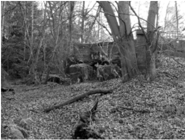
Bunkerruine im Bienwald

Drei von sieben untersuchten Anlagen wurden im Untersuchungszeitraum von Wildkatzen aufgesucht (beispielsweise zum Sonnen auf warmen Betontrümmern, Katze und Kuder während der Rollzeit gemeinsam in derselben Anlage). Gestützt werden diese Ergebnisse durch Telemetriedaten aus der 2-jährigen Überwachungsphase des Artenschutzprojekts Wildkatze in NRW. In 2 von 3 Bunkern wurde regelmäßiger Aufenthalt dokumentiert, unter anderem bei schlechten Witterungsverhältnissen wie Gewitterstürmen und hohen Schneelagen, wobei die Tiere die Anlage oft tagelang nicht verließen. Das Verlassen der Anlage zur Nahrungsbeschaffung ist auch nicht zwingend notwendig, da die Anlagen ebenfalls Winterquartier für Kleinsäuger sind, wie Schneespurkartierungen zeigten. Davon profitieren auch der Fuchs und Marderartige.