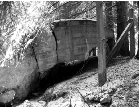
Bunker mit alter Zäunung

Ziel dieser vom LUWG in Auftrag gegebenen Untersuchung ist es, zu überprüfen, welche Bedeutung die Bunker für Säugetiere besitzen. In diesem Zusammenhang war die Frage, inwieweit im Auftrag des MUF vorgenommene Umgestaltungsmaßnahmen geeignet sind, die Funktionen zu erhalten. Im Bienwald, der Südwestpfalz und in der Schneifel wurden auf Betreiben der Landespflegeverwaltung einige Bunker, die zur Einebnung vorgesehen waren, nur mit Erde abgedeckt und für Tierarten durch künstliche Zugänge nutzbar gemacht. Bei der Umgestaltung wurde Wert auf die Erhaltung von Hohlräumen gelegt und Rohre als Zugänge eingebaut, die Anlagen außen aber vollständig verfüllt. Alle nicht umgestalteten Anlagen im Bienwald und einige in der Schneifel wiesen eine alte Umzäunung auf. Die Zäunung war vermutlich in den 60er/70er Jahren mit Maschendrahtzaun erfolgt. Durch herabfallende Äste, Bäume und marodes Material lagen etwa 40-80% des Zaunmaterials am Boden und stellen hierdurch eine potentielle Gefährdung für Menschen und Tiere dar. Die Zäune waren auch nach deren Zerfall nicht beseitigt worden.